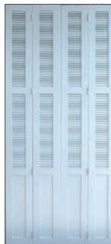
Volet 24 mm repliable