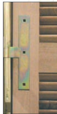
Penture encastrée (option)