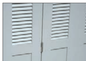
Détail paumelles inox