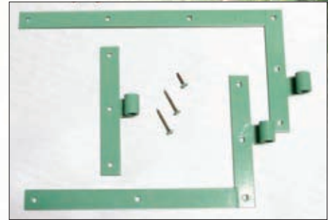
Laquage ferrage RAL au choix