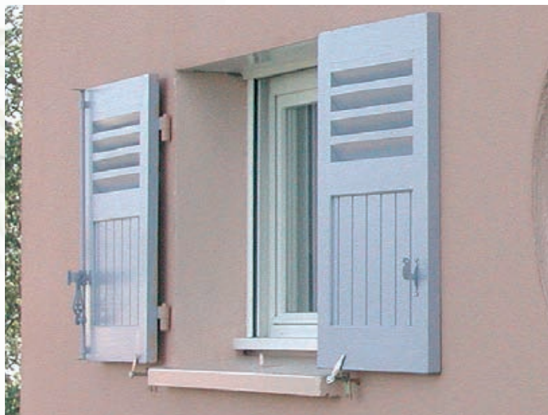
Ajourage 1/3 haut - 2/3 bas lames verticales

Fabriqués de manière traditionnelle nos volets à cadres sont faits pour durer. Ces volets proposent une grande variété de combinaisons afin de s'adapter à vos façades quelle que soit votre région. Ajourés totalement ou combinés à six types de panneaux de remplissage, il est difficile de ne pas trouver le vôtre ! Ajoutons à ceci le ferrage par pentures équerres (extrémités droites ou queues de carpe), ainsi que la possibilité d'une lasure ou peinture de finition et vos volets sont finis en même temps qu'ils sont posés.