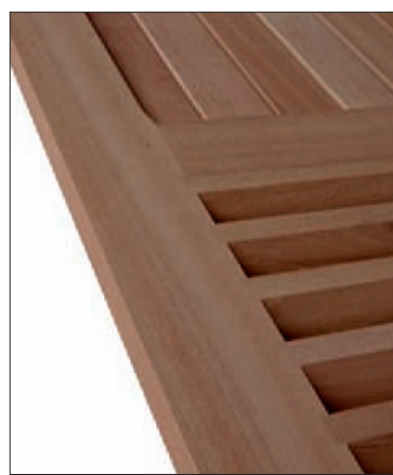
1/3 haut ajouré, 2/3 bas lames massives verticales