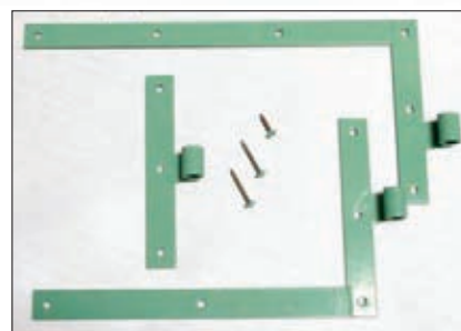
Laquage ferrage RAL au choix