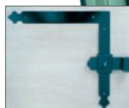
Penture de rénovation

Ce volet est réalisé en profil 75 x 30 assemblé à coupe 45° aux angles, avec inserts de maintien, battement central par couvre joint muni d'un joint à frappe élastomère noir. Dimension des lamettes : 50 x 10 mm